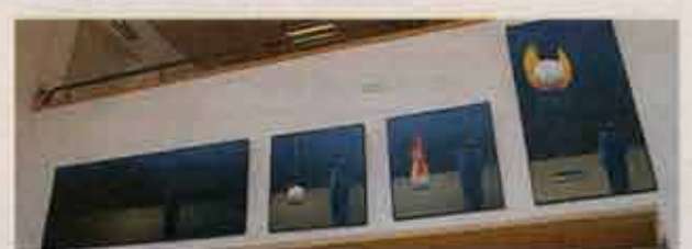
Vissa bilder har hängts upp på ovanliga platser.