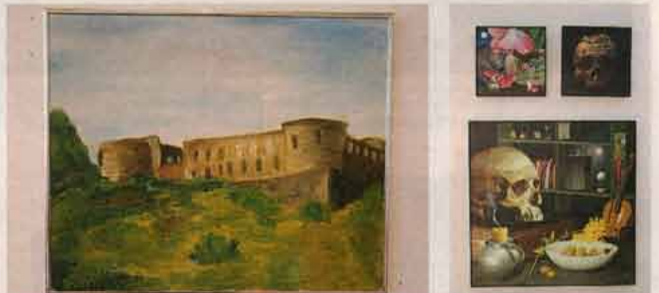
Tavlorna är målade mellan 1947 och 2015.